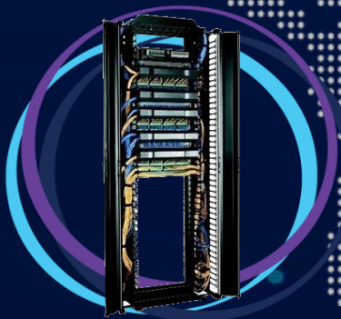
Centros de datos