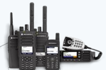
Radiocomunicación Motorola y accesorios