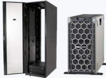
Servidores para centros de datos