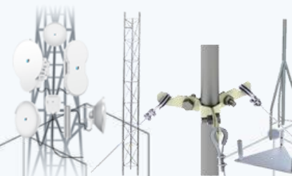
Equipo y Antenas para Telecomunicaciones