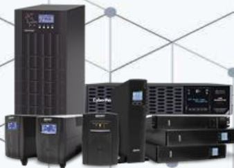
Respaldos de Energía UPS y PDU's