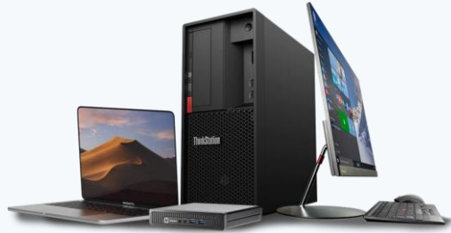
Equipo de cómputo Empresarial