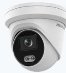
Sistemas de Videovigilancia