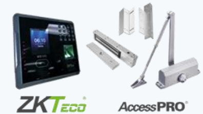
Controles de acceso.